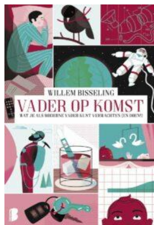
Vader op komst

De auteur maakt gebruik van zijn eigen ervaringen en geeft daardoor nuttige adviezen. Deze helpen de lezer op weg om zich te oriënteren in de wereld van het vaderschap tijdens de eerste 1000 dagen. Willem Bisseling vertelt openhartig over het vallen en opstaan in het nieuwe bestaan, de taakverdeling tussen beide ouders en intimiteit na de bevalling. De kraamhulp krijgt bovendien van hem goede credits: onverwachts zijn de ouders daar enorm mee geholpen.