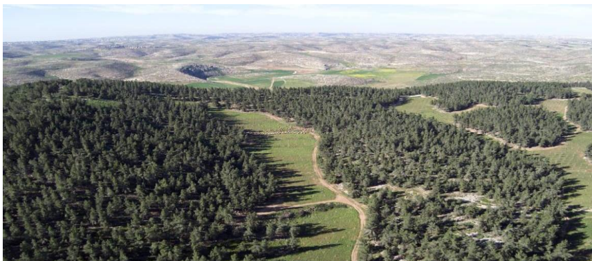
Yatir Forest – JNF.