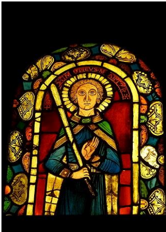
De heilige Timoteüs, gebrandschilderd raam uit de Abdijkerk van Saint-Pierre-et-Saint-Paul (ca. 1160), thans in het Musée national du Moyen Âge , Parijs.

* Op dit moment viert het Joodse volk het Loofhutzenfeest (Soekot). Wat weet jij daarvan (betekenis)? Hoe zou Timotheüs dit feest vieren?