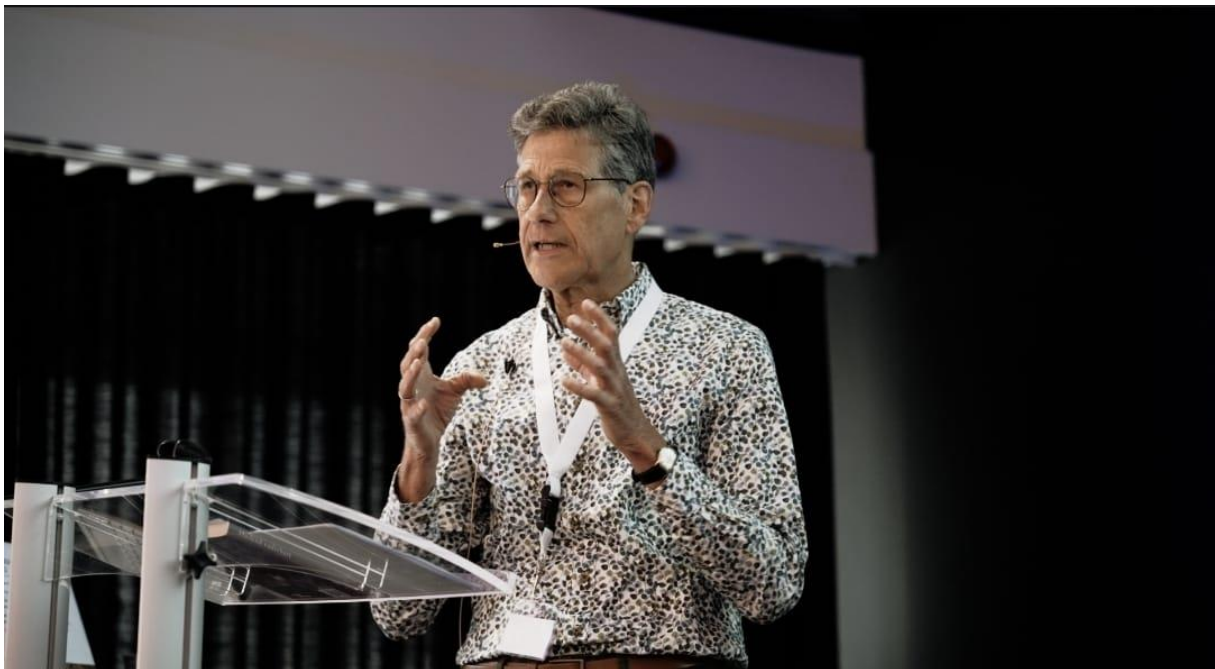
Presentatie tijdens het Zorgcongres, 15-04-2025.